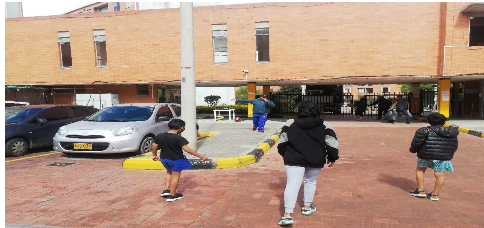
Conjunto Residencial Barichara (Maipore)